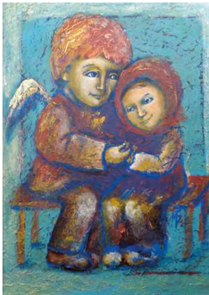
Ангел-хранитель Ange gardien