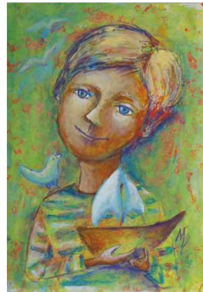
Корабль для мечты Un petit bateau pour les rêves

les turquoises, les roses nacrés, les jaunes et la couleur chaude de l'ocre. La couleur est, pour moi, non seulement un élément décoratif, mais également un moyen de transmettre une humeur, un état d'esprit.