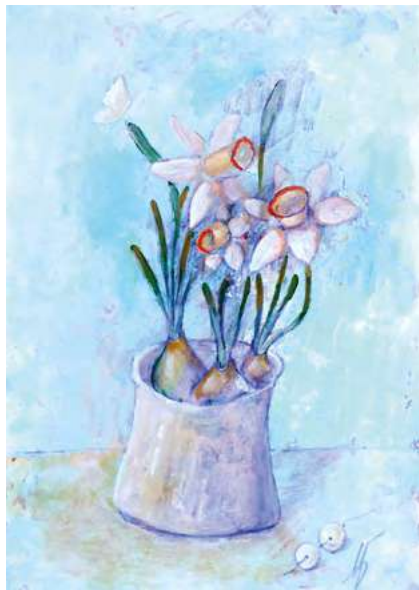
Весна с бабочкой Le printemps avec un papillon